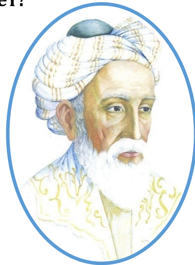
Персидский философ, математик, астроном и поэт